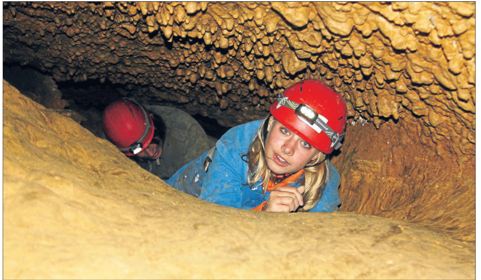
Kopf einziehen: Auf dem Bauch robben die Schüler durch das lehmige Nadelöhr in der unerschlossenen Höhle bei Riedenburg.