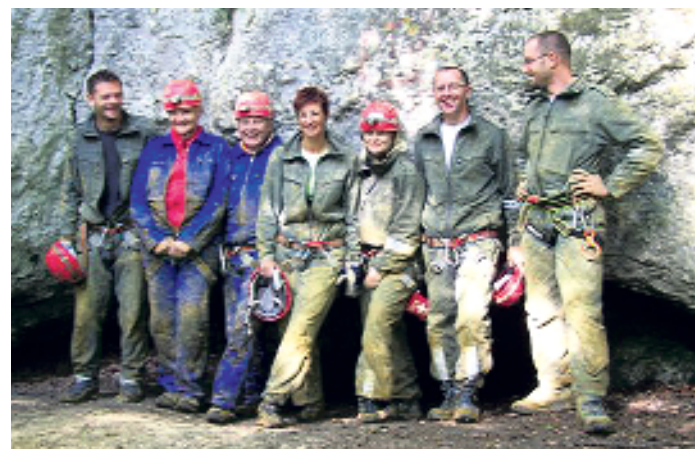
Dreckig wie die Maulwürfe, aber glücklich und um eine tolle Erfahrung reicher: Die Teilnehmer der Höhlentour.